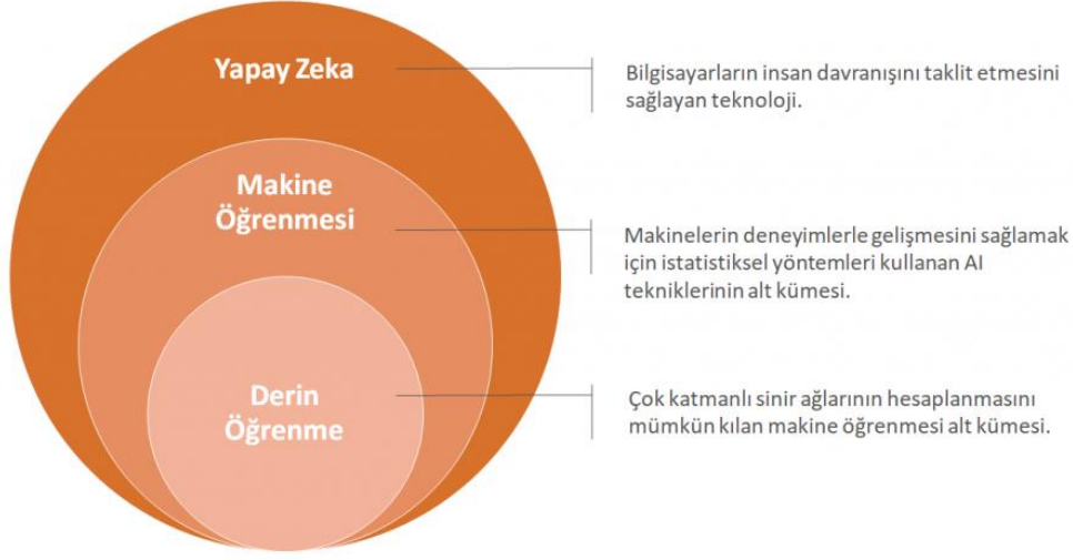
Şekil 1. Yapay Zekânın Alt Dallarını Gösteren Örnek 64

Bu modeller: denetimli öğrenme, denetimsiz öğrenme, yarı denetimli öğrenme ve pekiştirmeli öğrenme modeli olmaktadır 65 .